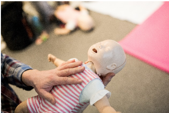
Für Kinder gelten bei der Ersten Hilfe andere Regeln als bei Erwachsenen, beispielsweise bei der Herzdruckmassage. Das kostenlose Online-Seminar der AOK gibt Tipps, wie man in Notfallsituationen richtig reagiert.

Für Ihre Berichterstattung in Verbindung mit dieser Pressemitteilung können Sie die beigefügten Fotos bei Angabe des Bildnachweises kostenfrei verwenden.